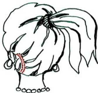
Kuva1. Leikkaus tehdään yleensä korvan takaa.

Toisena hoitona voidaan käyttää myös stereotaktista sädehoitoa (STT-sädehoito) pieniin kasvaimiin. Sitä annetaan gammaveitsi- tai Linaker-laitteella. Suomessa gammaveitsihoitoja ei voi antaa, vaan potilaat lähetetään Ruotsiin hoitoa saamaan.