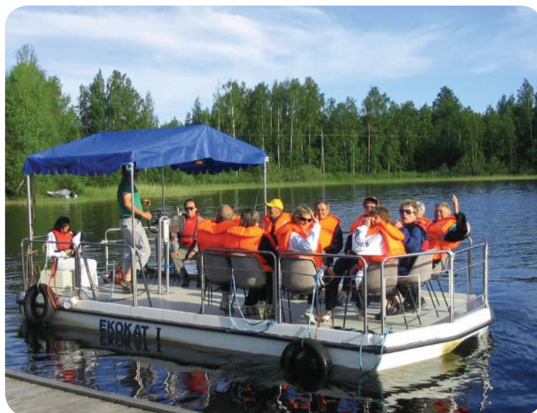
Akustikusneurinoomayhdistyksen voimavarakurssilla kesällä 2007.